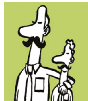
ILLUSTRATION: NIELS BO BOJESEN

https://journalistforbundet.dk/tilmelding-mentor