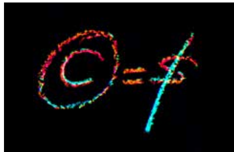
ILLUSTRATION: KARINA BJERREGAARD

Sørg i alle tilfælde så vidt muligt for, at dit ID optræder i kolofonen.