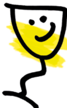
ILLUSTRATION: KARINA BJERREGAARD