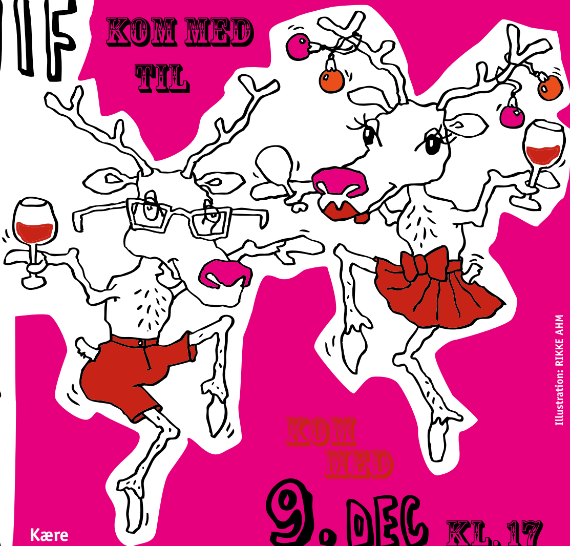
Illustration: RIKKE AHM