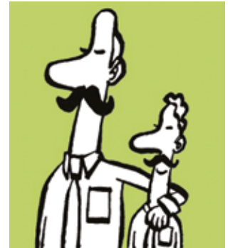
ILLUSTRATION: NIELS BO BOJESEN

Find flere kurser på https://journalistforbundet.dk/events