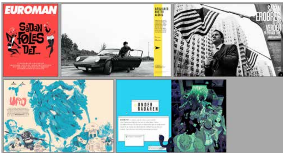
Ved kåring af bedste magasindesign i 2015 blev Euroman kåret som Årets magasin

Læs mere på: http://kreds1.dk/Legater--tilskud/Tilskud/