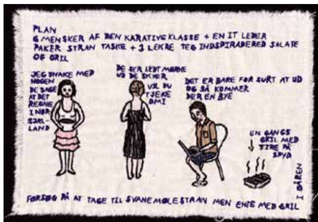
Værk af Gudrun Hasle