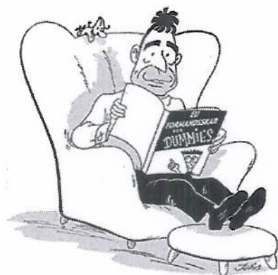
20.0.02 Den danske regering er velberedt til at overtage EU formandskabet.