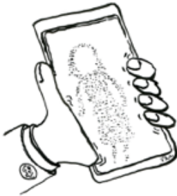
Tegning: Frits Ahlefeldt