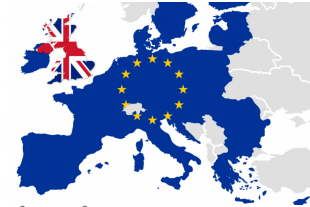
Få styr på, hvordan du kan bruge guldgruben af nyheder og historier fra hele EU