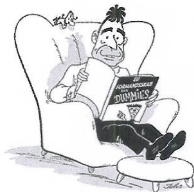
20.0.02 Den danske regering er vefforbæredt til at overtage EU formandskabet.