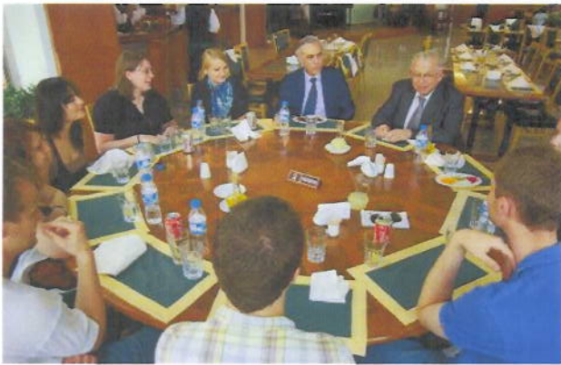
Haluk Kabaalioglu (øverst th)

Haluk Kabaalioglu blev via vores notater brugt i artiklen "Krisemøde i Tyrkiets regering" og "Tyrkiets regeringsparti raser over domstol" af udlandsredaktionens Finn Hansen fra 6/6